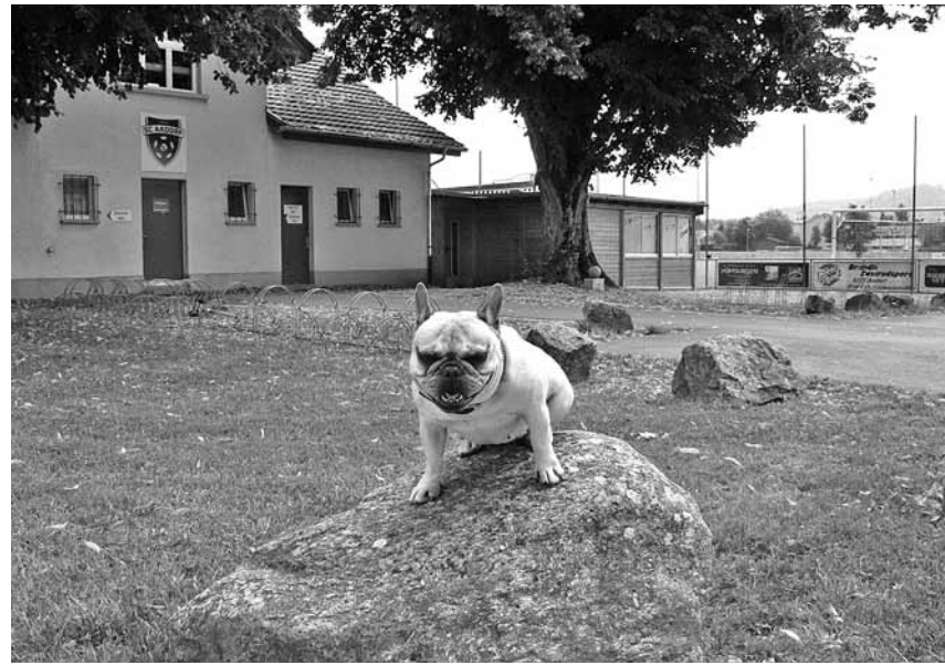
Auf dieser Wiese führte die Frau ihren Hund Gassi. Bevor die Polizei vor Ort war, verschwand sie von der Bildfläche. Der abgebildete Hund ist übrigens lieb und harmlos und hat nichts mit der bedauerlichen Geschichte zu tun.

Ein Mann auf der gegenüberliegenden Strassenseite beobachtete den gerade noch einmal glimpflich ausgegangenen Vorfall. Eindringlich riet er den Betroffenen, die zwar keinen körperlichen Schaden genommen hatten, die Hundehalterin und ihre Tiere der Polizei zu melden. In Anbetracht eines eindeutigen Zeugen wurde dies auch veranlasst, noch während die Frau daran war, ihre beiden Hunde beim Clubhaus des SC Aadorf Gassi zu führen. Die alarmierte Polizeistreife konnte die Frau dann aber leider nicht mehr zur Rede stellen, weil sie sich inzwischen, möglicherweise mit einem Auto, entfernt hatte. Gemäss einem Sprecher der Kantonspolizei Thurgau erfolgte die Meldung an die Dienststelle vollkommen zu Recht. Man werde