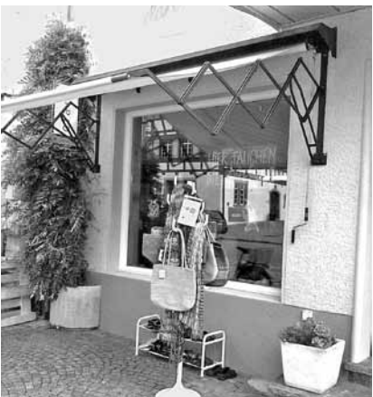
So präsentiert sich die Ladenfront im neuen Kleid.